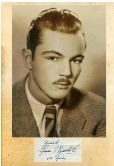
Фотографија Душана Ј. Ђоновића из студентског досјеа

Први легат који је удомљен у Библиотеци јесте Легат Душана Ј. Ђоновића. Душан Ј. Ђоновић (1920–1995) је један од представника српске интелигенције у емиграцији након Другог свјетског рата, и један од оних људи чије дјеловање је оставило трага у националној историји. Нажалост, деценије систематског, изузетно марљивог и прецизног рада комунистичке пропаганде, избрисале су из историје све трагове који нису слиједили идеолошки пут Комунистичке партије Југославије.